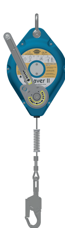
GSE414G / GSE414SSK 14 m