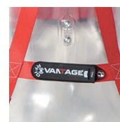
Targa di identificazione portetta con RFID