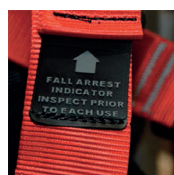
Indicatore di caduta