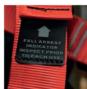
Indicatore di caduta