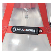
Targa di identificazione portetta con RFID