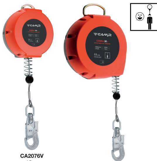
CA2076V 10 m CA2077V 15 m CA2078V 20 m