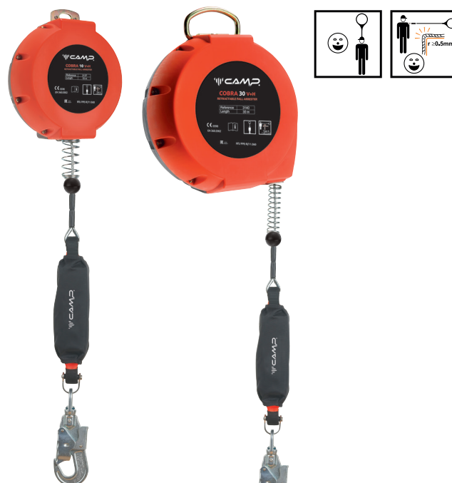
CA3137 10 m CA3138 15 m CA3139 20 m