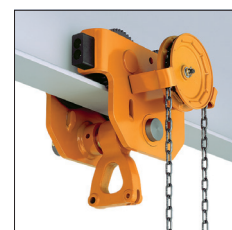
Carrello a catena TSG con sospensione C (3 t e 5 t) TSG geared trolley with C type suspension (3 to 5 t)