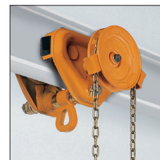
Carrello a catena TSG con sospensione H (fino a 3 t) TSG geared trolley with H type suspension (up to 3 t)