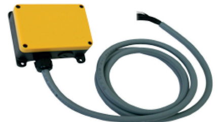
Ricevitore fornito standard precablato Pre-wired standard receiver