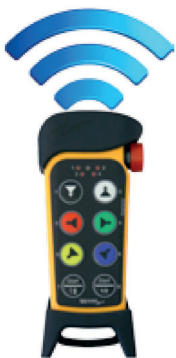
Frequenza libera Wi-Fi 2,4 GHz Free Wi-Fi 2.4 GHz frequency