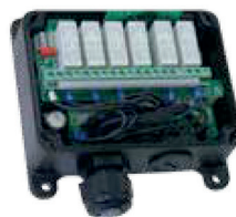
Ricevitore programmabile End-User con funzioni Master-Slave e Take-Release End-User programmable receiver with Master-Slave and Take-Release functions