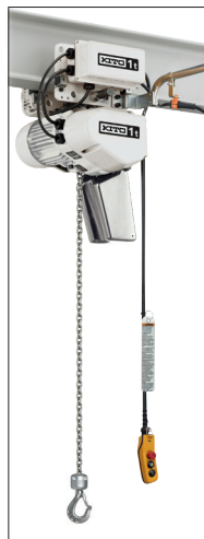
Verniciatura epossidica bianca White epoxy paint