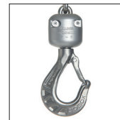
Gancio bozzello di acciaio inossidabile Stainless steel bottom hook