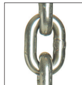
Catena di carico nickel plated Nickel plated load chain