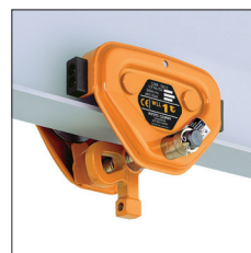
Carrello a spinta TSP con sospensione C (fino a 2,5 t) TSP plain trolley with C type suspension (up to 2,5 t)