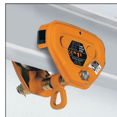
Carrello a spinta TSP con sospensione H (fino a 3 t) TSP plain trolley with H type suspension (up to 3 t)