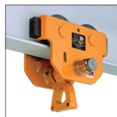
Carrello a spinta TSP con sospensione C (3 t e 5 t) TSP plain trolley with C type suspension (3 to 5 t)